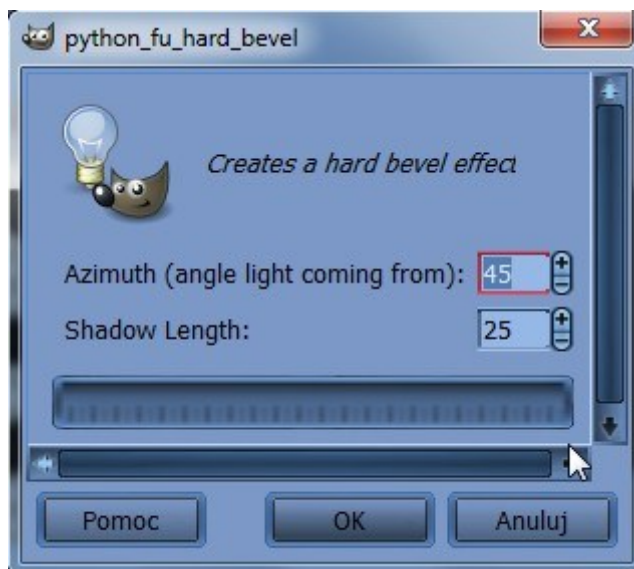
Domyślne Opcje wtyczki hard_bevel